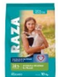
RAZA GATOS PESCADO CON OMEGA 3 Y 6 10KG