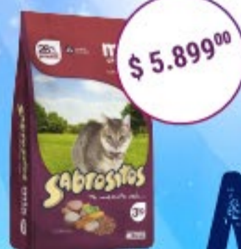
Sabrositos Gatos Sabor Mix x 3 kg

EN EL DÍA DEL ANIMAL ENCONTRÁ LAS MEJORES OFERTAS PARA TUS MASCOTAS EN MAKRO!!!