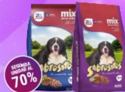
Sabrositos Perros Adultos Sabores varios x 1,5 kg