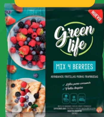
MIX FRUTOS ROJOS GREEN LIFE x 400 GR x KG: $ 12.499,98