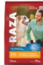
RAZA PERROS ADULTOS CON PROBIÓTICOS Y PLUS DE PROTEÍNAS 15KG