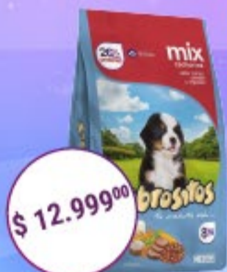
Sabrositos Cachorros Sabor Mix x 8 kg