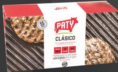
HAMBURGUESAS PATY CLÁSICAS x 12 U