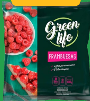
FRAMBUESAS GREEN LIFE x 400 GR x KG: $ 19.999,98