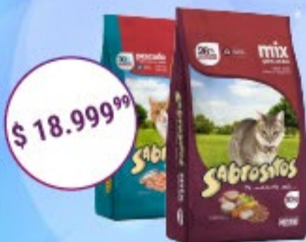
Sabrositos Gatos Sabor Pescado x 10 kg