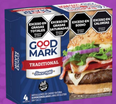
MEDALLONES DE CARNE GOODMARK x 4 U x 80 GR x KG: $ 6.182,28