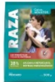
RAZA GATOS PESCADO PREBIÓTICOS 500G