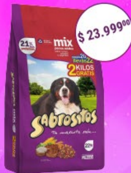
Sabrositos Perros Adultos Sabor Mix x 22 kg