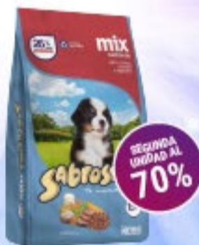
Sabrositos Cachorros Sabor Mix x 1,5 kg