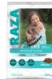
RAZA GATOS PESCADO REDUCIDO EN CALORÍAS 500G