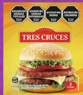
MEDALLONES DE CARNE TRES CRUCES FLOW x 2 U x KG: $ 4.727,18