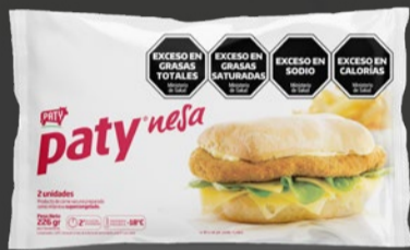
PATYNESA FLOW x 2 U x KG: $ 7.831,81