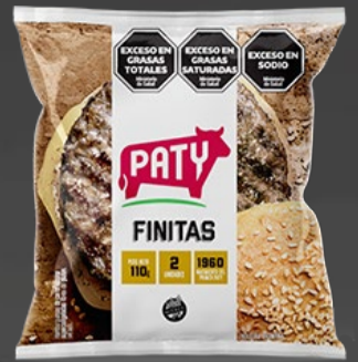
HAMBURGUESAS PATY FINITAS x 2 U x 110 GR x KG: $ 8.090,82