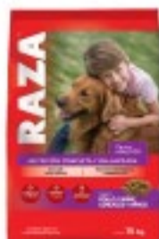
RAZA PERROS ADULTOS POLLO, CARNE, CEREALES Y ARROZ 15KG