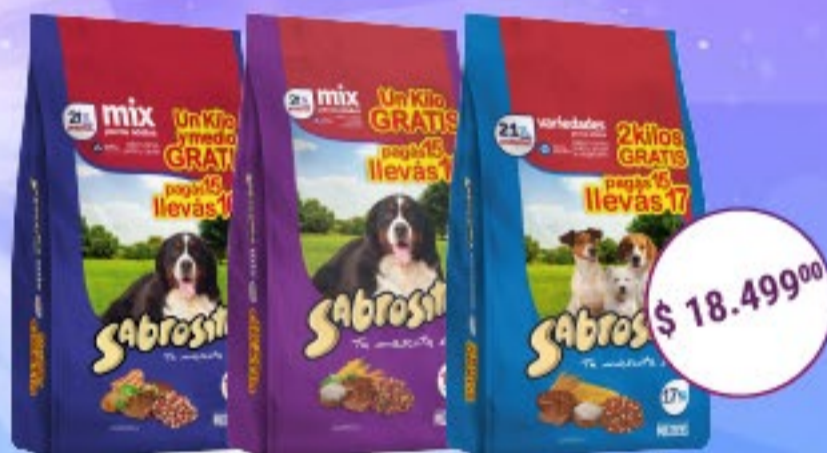
Sabrositos Perros Adultos Sabores varios x 15 kg