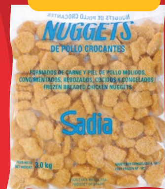
NUGGETS DE POLLO SADIA CROCANTES x 3 KG x KG: $ 5.483,33