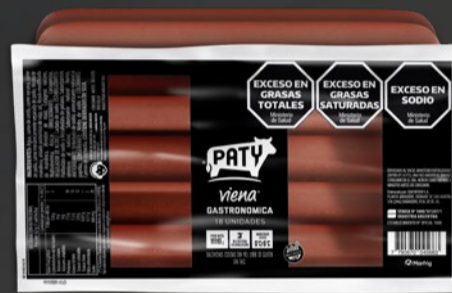
SALCHICHAS PATY VIENA GASTRONÓMICAS x 18 U x KG: $ 4.955,35