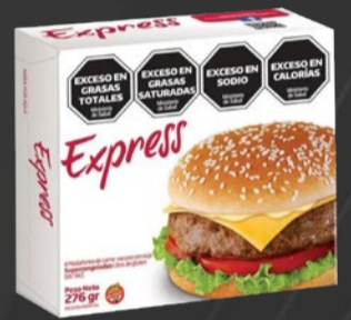
MEDALLONES DE CARNE CON SOJA PATY EXPRESS x 4 U x 69 GR x KG: $ 6.141,27