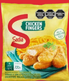
CHICKEN FINGERS SADIA x 720 GR x KG: $ 8.055,54