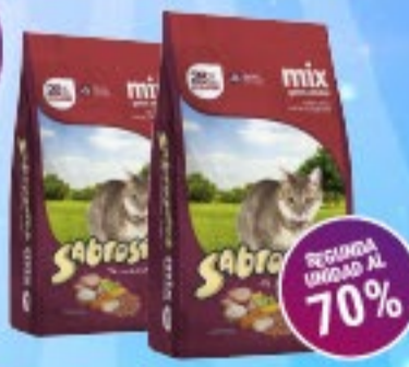
Sabrositos Gatos Sabor Mix x 500 g / 1 kg