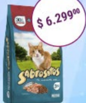
Sabrositos Gatos Sabor Pescado x 3 kg