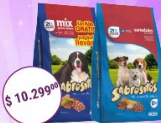
Sabrositos Perros Adultos Sabores varios x 8 kg