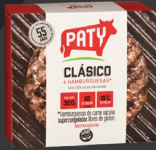
HAMBURGUESAS PATY CLÁSICAS x 4 U x KG: $ 8.984,34