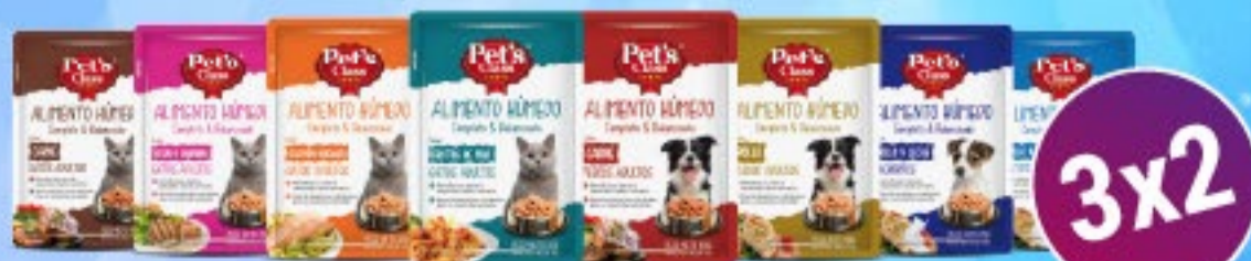
Alimento Húmedo en Pouch Pet's Class x 85 / 100 g

EN EL DÍA DEL ANIMAL ENCONTRÁ LAS MEJORES OFERTAS PARA TUS MASCOTAS EN MAKRO!!!