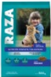
RAZA GATOS PESCADO 500G