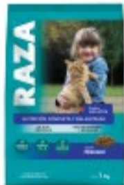
RAZA GATOS PESCADO 1KG