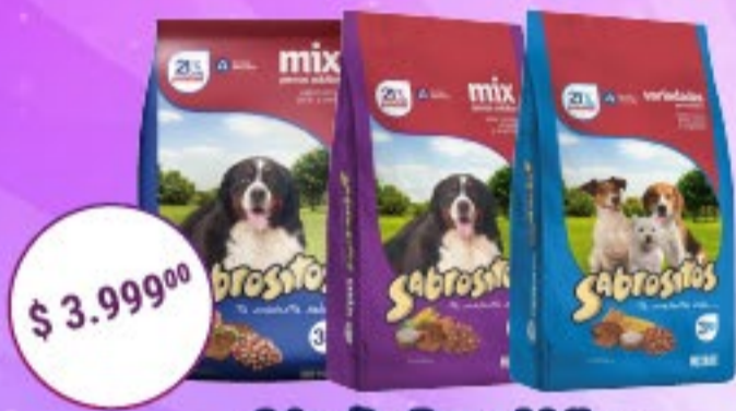
Sabrositos Perros Adultos Sabores varios x 3 kg