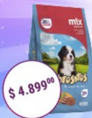
Sabrositos Cachorros Sabor Mix x 3 kg