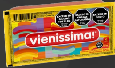
SALCHICHAS VIENISSIMA SIN TACC x 6 U x KG: $ 5.217,35