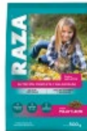
RAZA GATOS POLLO Y LECHE 500G